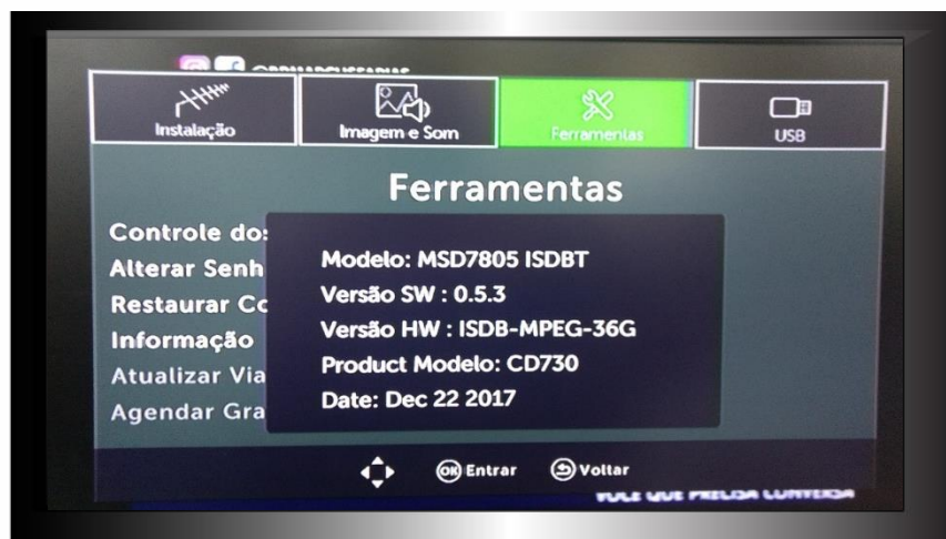
Figura 3 – Versão de Firmware

Após a atualização do software será necessário refazer a busca de canais em seguida acesse o MENU, escolha a opção Ferramentas e em seguida Informação e verifique se o firmware foi atualizado com sucesso.