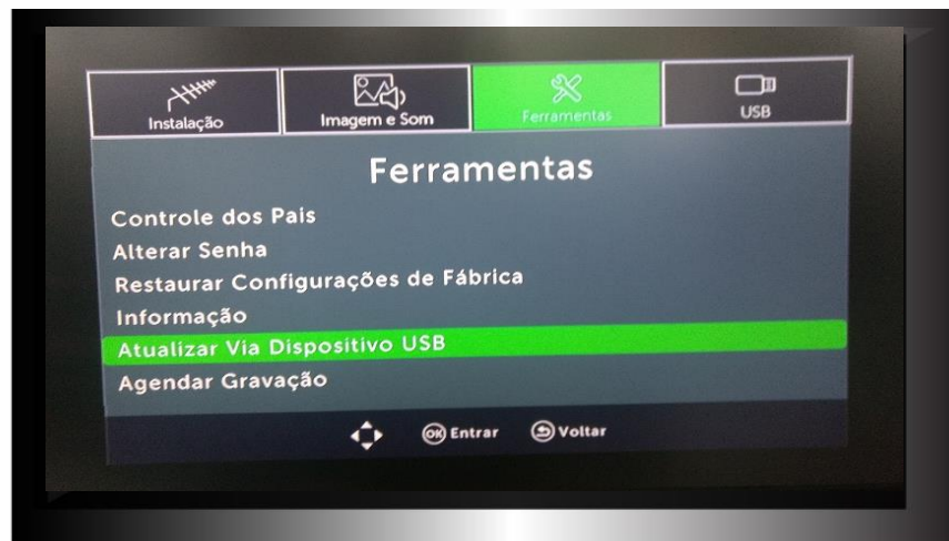
Figura 2 – Tela Ferramentas

Entre no Menu Principal através da tecla MENU do controle remoto, escolha a opção Ferramentas e em seguida Atualizar via dispositivo USB.