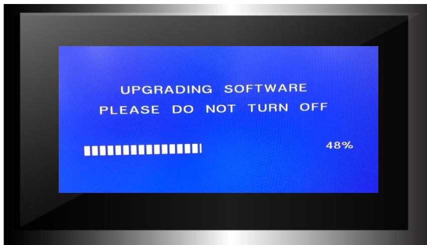
Figura 1 – Atualização de software

Retire o conversor digital CD730 da energia elétrica e conecte o pen drive na porta USB. Em seguida conecte o produto na energia elétrica e a atualização iniciará automaticamente conforme mostra a figura 1.