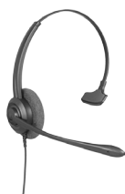
CHS 60 Headset mono QD