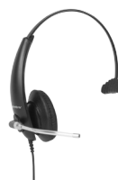
THS 50 Headset mono QD