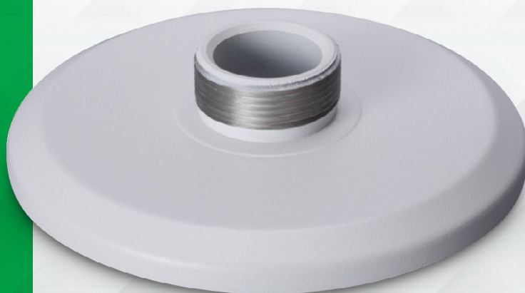
Adaptador para speed dome