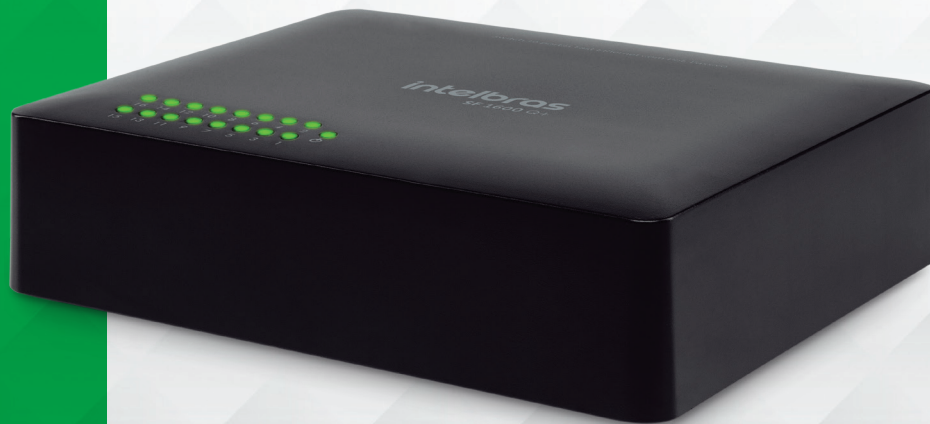
Switch 16 portas Fast Ethernet