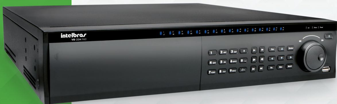
Gravador digital de vídeo 32 canais