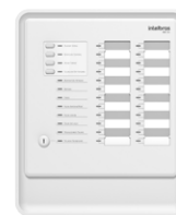
Central de incêndio convencional