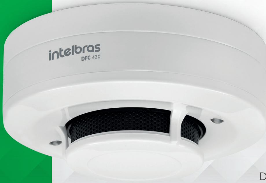
Detector de fumaça convencional