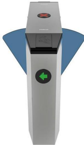
CAF 5000 Central