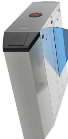
CAF 5000 M Lateral