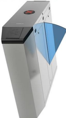
CAF 5000 M Lateral