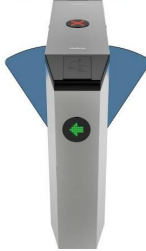
CAF 5000 Central