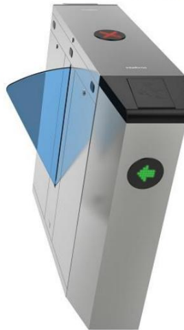
CAF 5000 S Lateral