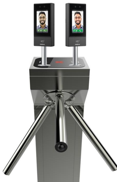
Foto do produto