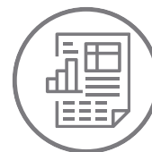
Geração de relatórios