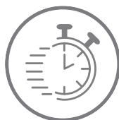
Cadastro rápido de visitas