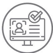
Ferramenta de cadastro de faces com IA