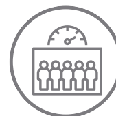
Contagem de pessoas nas áreas