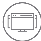
Sincronização de usuários entre InControls