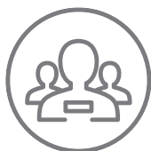
Baixa automática de visitas