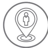
Localização de usuários nas áreas