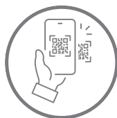
Geração de QR Code para visitas