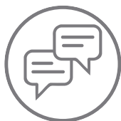
Suporte via chatbot embarcado