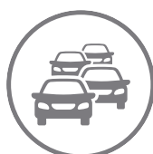
Cadastro de veículos