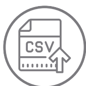
Importação de usuários/visitantes via CSV