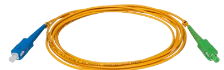
XFC 3M 12 / XFC 5M 12 Cordão Óptico SC/UPC-SC/APC SM 3 metros e 5 metros