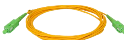
XFC 3M 2 / XFC 5M 2 Cordão Óptico SC/APC SM 3 metros e 5 metros