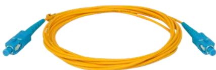
XFC 3M 1 / XFC 5M 1 Cordão Óptico SC/UPC SM 3 metros e 5 metros