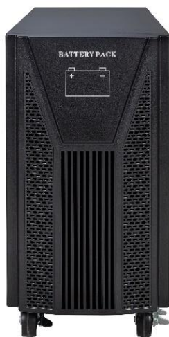
MB 1607 192V TW

Módulo de baterias externas 192 V (16 x 7 Ah)