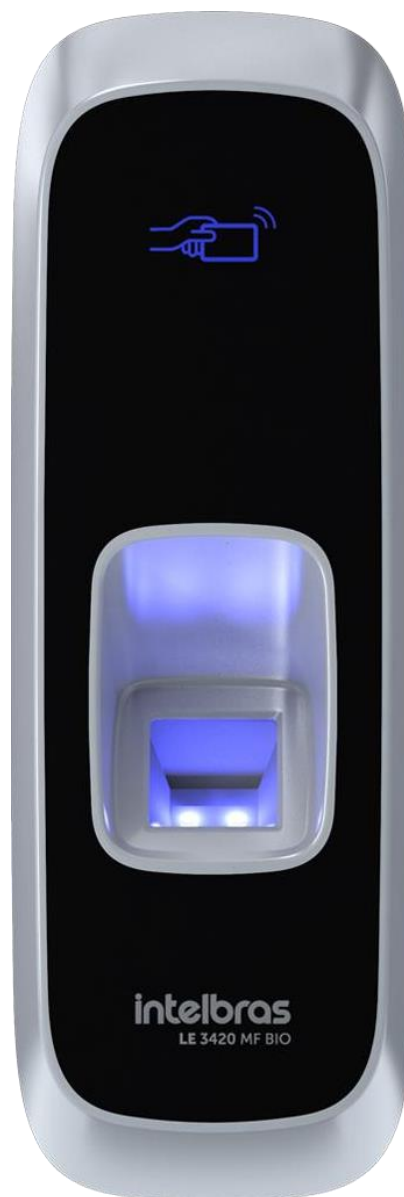
LE 3420 MF BIO