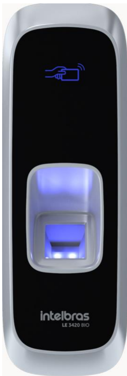
LE 3420 BIO