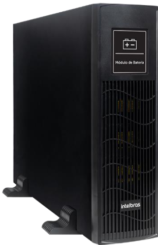
MB 2009 240V RT

Módulo de baterias externas 240 V (20 × 9 Ah)