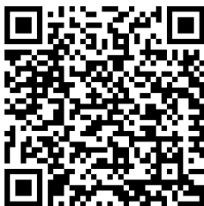
Mini 3 kW

Para visualizar mais informações sobre o produto e documentos, por favor, acesse a página do produto através do QR Code abaixo.