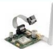
XAG 8000 Módulo GPRS