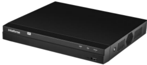
Gravador Digital de Vídeo NVD 1408