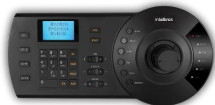
Mesa Controladora Híbrida (Análogica e IP) VTN 2000