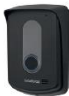
TIS 5000 Ramal externo sem fio