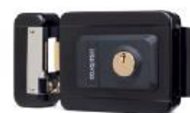
FX 2000 Preta Fechadura elétrica