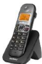
TS 5121 Ramal sem fio digital