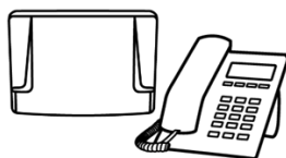
Central Telefônica e Telefone