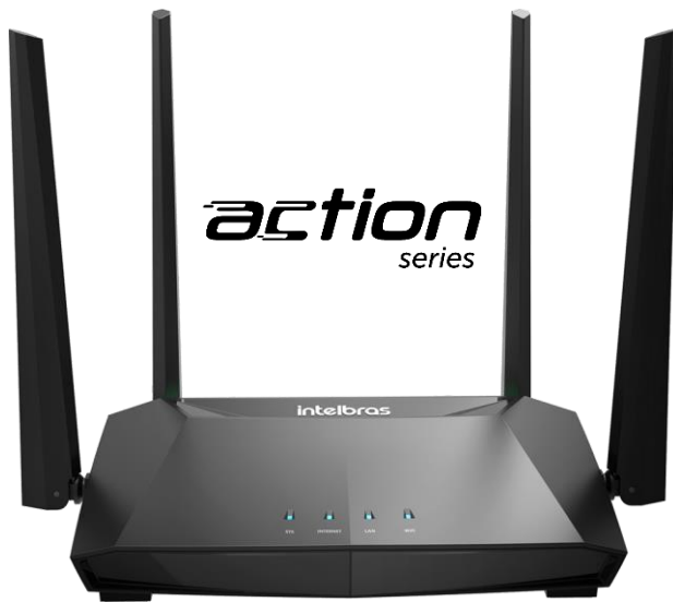
Roteador ACTION RG 1200