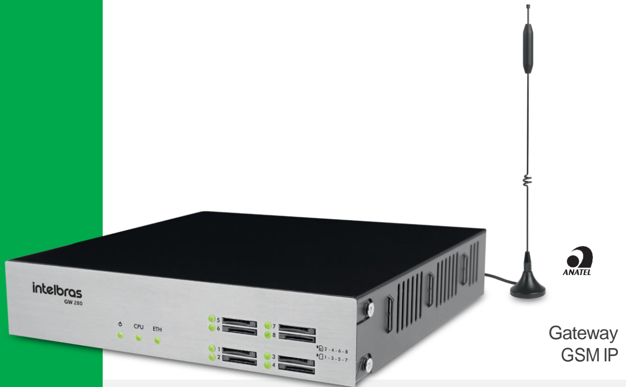
Gateway GSM IP