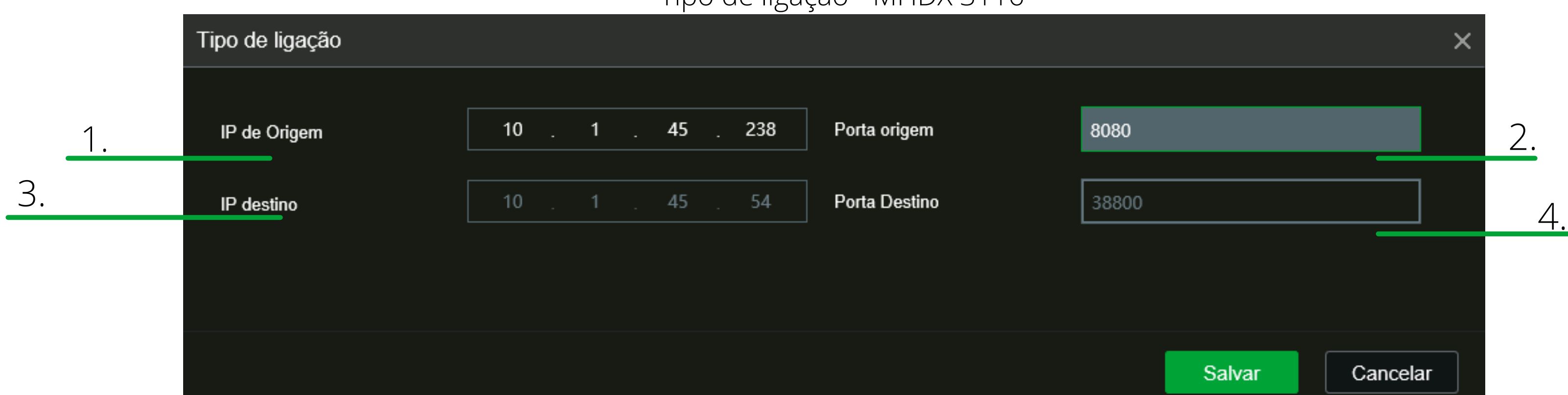
*Tipo de ligação - MHDX 3116

clique sobre a imagem para ser direcionado ao manual