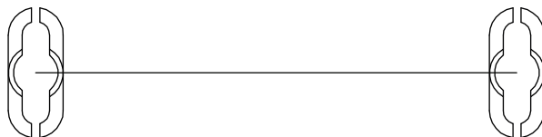
Fixação da ONU na parede