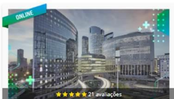
Treinamento Software Defense IA - Operação Cliente

Técnico Software Defense IA - Controle de acesso