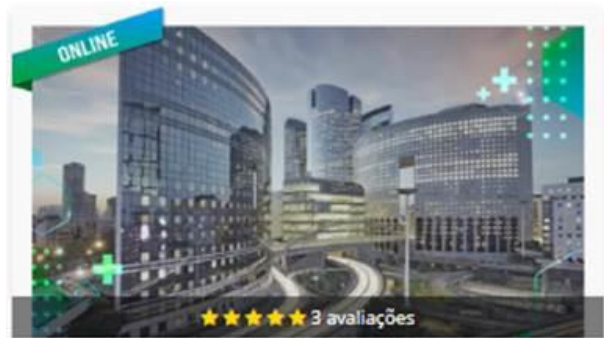
Técnico Software Defense IA - Controle de acesso

Técnico Software Defense IA - Alarmes e sensores