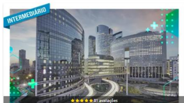
Treinamento Comercial Software Defense IA