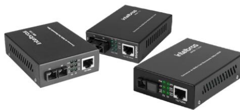
Conversores de mídia

Suporte a clientes: (48) 2106 0006 Fórum: forum.intelbras.com.br Suporte via chat: intelbras.com.br/suporte-tecnico Suporte via e-mail: suporte@intelbras.com.br