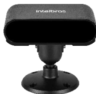
iFleet Smart G2