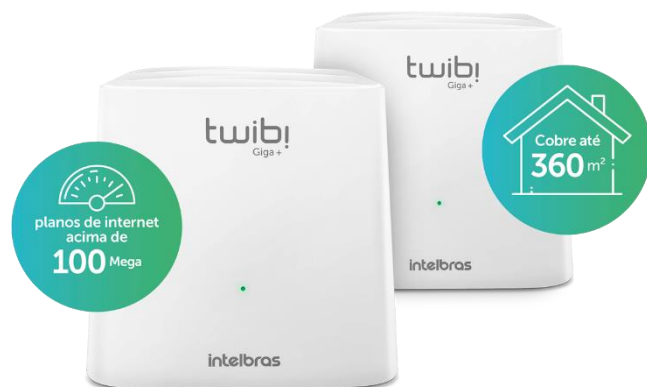
Kit Twibi Giga+