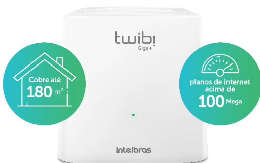
Módulo Twibi Giga+

A instalação e o gerenciamento podem ser feitos através do aplicativo Wi-Fi Control Home ou da interface web de forma simples e prática.