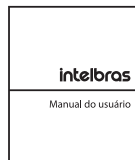
1× Manual do usuário