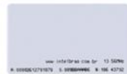
TH 2000 MF Cartão RFID 13,56 MHz