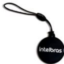
XID 1000 Chaveiro RFID