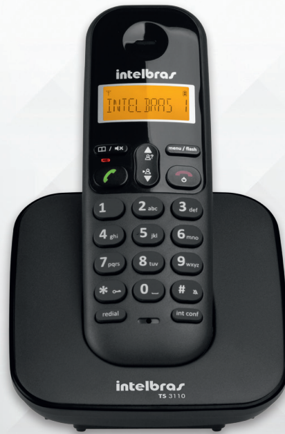
Teléfono inalámbrico digital