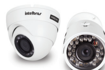
Linha de câmeras HDCVI Série 3000