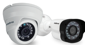
Linha de câmeras analógicas Série 1000