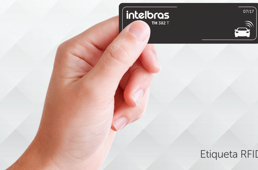
Etiqueta RFID UHF