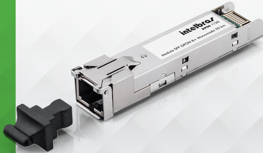
Módulo SFP GPON B+ Monomodo 20 km