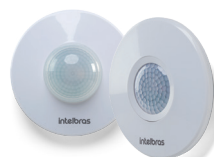
ESP 360 e ESP 360 +