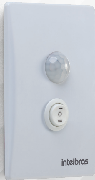
Sensor de presença para iluminação