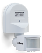
ESP 180 AE