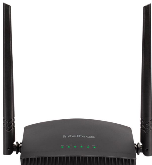
Roteador Wireless RF 301K