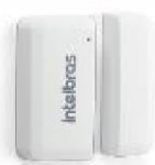
XAS 8000 Sensor de abertura magnético sem fio