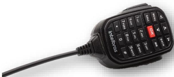
AMT 02 - Microfone com teclado.