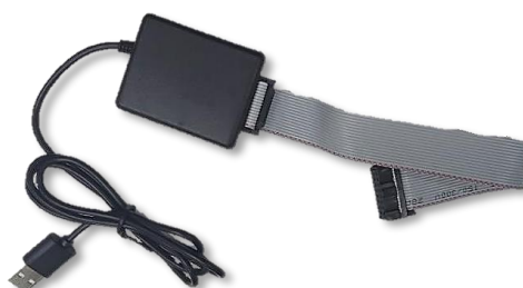
CP 7000 RM – Cabo de programação