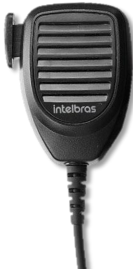
AM 01 - Microfone com PTT