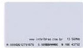
TH 2000 MF Cartão RFID 13,56 MHz