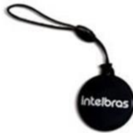
XID 1000 Chaveiro RFID