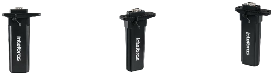
Foto do Pocket Wi-Fi EPWS 2000 aplicado