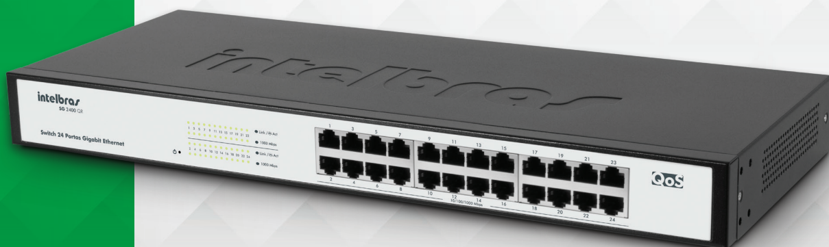
Switch rack 24 portas Gigabit Ethernet com QoS