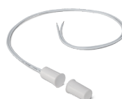
XAS EMBUTIR Sensor magnético de abertura com fio