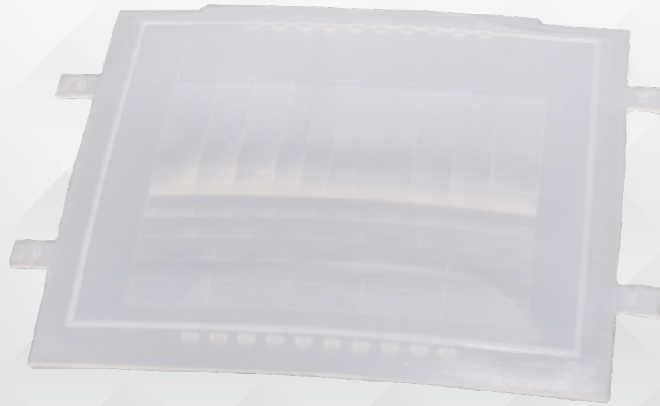
Lente fresnel para sensor IVP 3000 MW EX