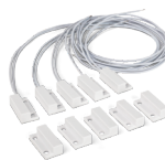
XAS SOBREPOR Sensor de abertura magnético com fio