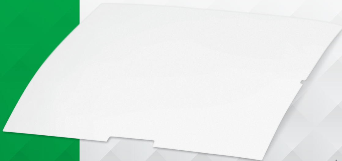
Lente fresnel para sensor